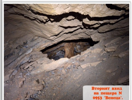
Вторият вход на пещера N 0953 "Венеца".