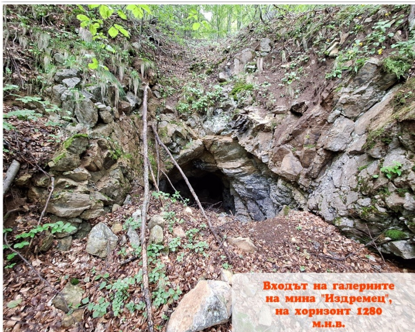
Входът на галериите на мина "Издремец", на хоризонт 1280 м.н.в.

Мината, към този момент, според Иво е безопасна за проникване, като все пак трябва да се подхожда с нужното внимание, към старите дървени конструкции и най-вече с вертикалните шахти.